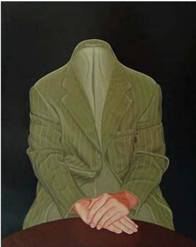
JOHN VAN DER VELDEN

...Mystérieuse alchimie des espaces fluides, en aplats de tons crus, faisant alliance avec le dessin aux traits clairs.